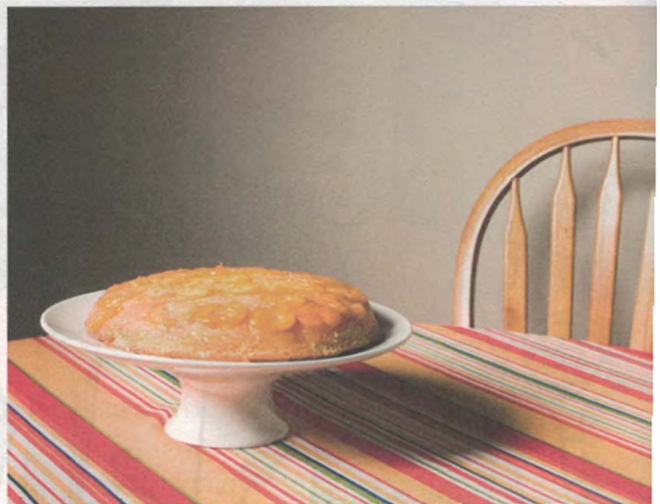
6 Le gâteau est .....SUR..... la table.