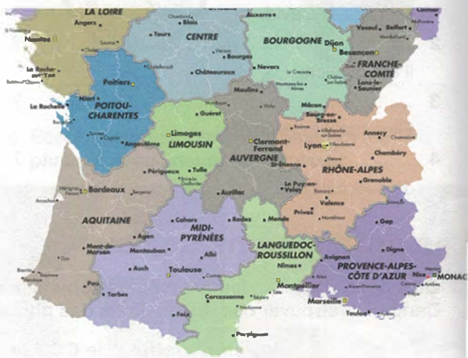
4 Nice se trouve .....EN..... Provence.