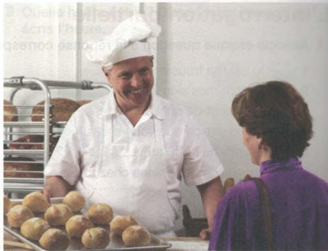
2 Elle est .....À..... la boulangerie.