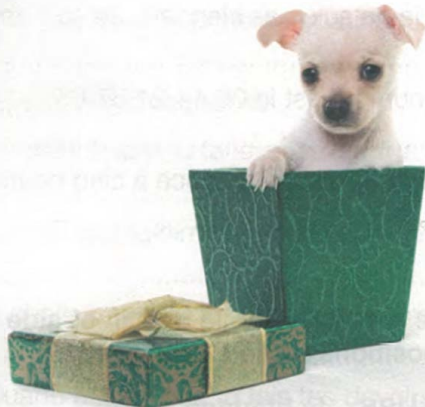
3 Le chien est .....DANS..... la boîte.